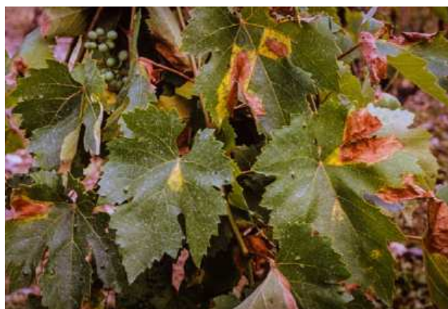
Symptoms caused by Pseudopezicula tracheiphila .

Les symptômes de brûlures foliaires ne sont pas véritablement spécifiques de la Maladie de Pierce. Cette maladie peut ainsi être confondue avec d'autres causes biotiques (Esca, Botrytis cinerea , nécrose bactérienne...), dont certaines sont illustrées en annexe de la présente note, ou abiotiques (chloroses) 2 . À titre d'exemple, les symptômes sur feuilles peuvent être confondus avec certaines maladies fongiques, en particulier le Rougeot parasitaire (Rotbrenner), une maladie fongique de la vigne causée par Pseudopezicula tracheiphila (Müll.-Thurg.) Korf & W.Y. Zhuang (1986) (Photo ci-dessous). Ces symptômes peuvent également parfois évoquer l'Esca ou le Black Dead Arm.