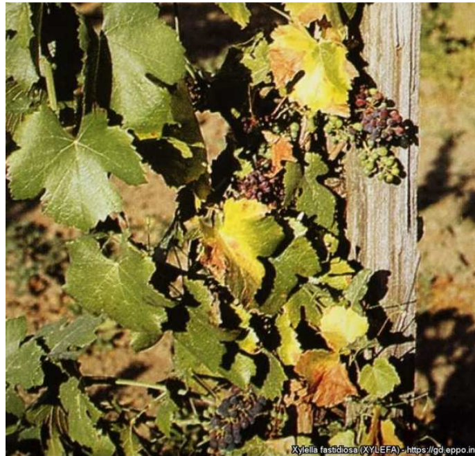
Yellowing and desiccation of grapevine leaves, and wilting of bunches, due to X. fastidiosa in the Napa Valley, California (US).

L'un des signes de contamination est le dessèchement rapide et soudain d'une partie des feuilles, qui se nécrosent tandis que les tissus adjacents deviennent jaunes ou rouges (photo ci-dessous 1 ).