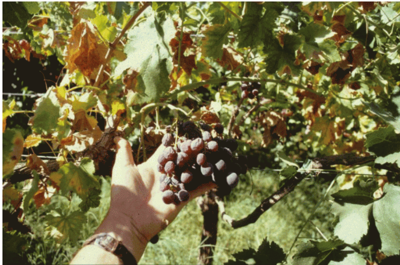
How Pierce's Disease affects wine grapes and vines.

Les grappes sont partiellement ou totalement flétries et rabougries (photo ci-dessous).