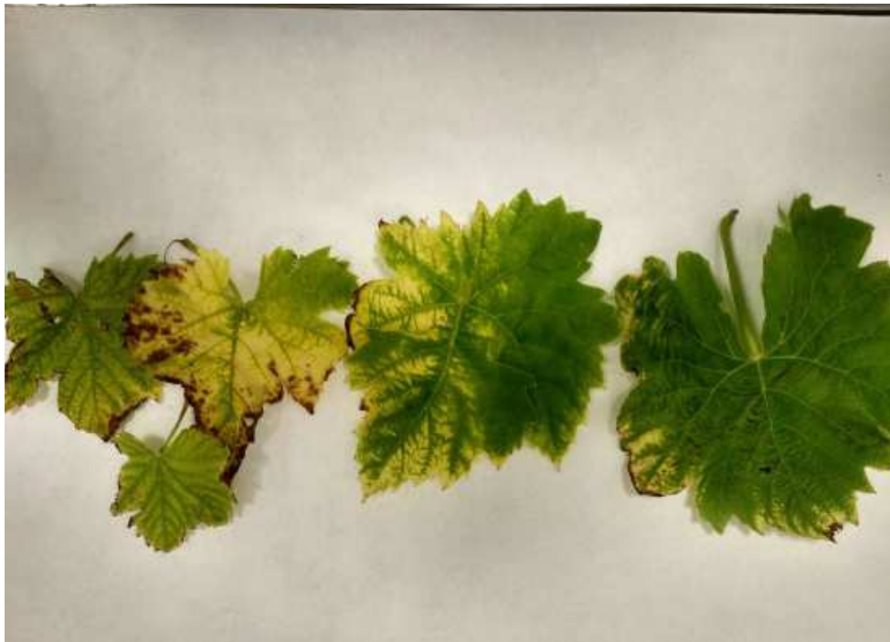
Symptômes de la maladie de Pierce observés à Majorque sur une vigne contaminée (mai 2017)