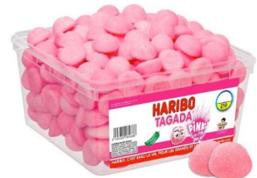
La célèbre Tagada rouge de la marque Haribo® de 1969 se décline dans de nouvelles couleurs : rose (Pink) en 2010, et violette (Purple) en 2016

Certaines marques peuvent être considérées comme nostalgiques : populaires dans le passé, les consommateurs ont noué des liens affectifs avec elles. D'autres ont aussi su jouer la carte de la nostalgie en s'attribuant une image de tradition et de patrimoine. Une marque ou un produit nostalgique doit cependant savoir se réinventer pour s'adapter à la société moderne en tenant compte des tendances actuelles (« nostalgie revisitée ») : changement de recette, teneur réduite en sucre ou en sel... La recherche de produits nostalgiques (voire régressifs) est plébiscitée par l'ensemble de la population mais sur des produits ou des marques très différents d'une génération à l'autre. Il est probable que chez les jeunes générations cette recherche de tels produits s'apparente davantage à des effets de mode, donc plus éphémères.