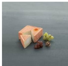
Maroilles : AOP depuis 1976

D'après les études du CRÉDOC (CCAF 2013), les produits régionaux de fabrication artisanale les plus consommés par les Français sont dans l'ordre d'importance : les fromages, la charcuterie, le vin, les produits laitiers et les plats cuisinés. La liste des produits régionaux de fabrication artisanale consommés devrait rester identique à l'avenir. Néanmoins, pour perdurer, il devra s'opérer une mise en conformité avec les usages et modes de consommation des nouvelles générations.