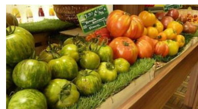
Tomates dites « anciennes »

La recherche de preuves ou de codes d'authenticité (via des story telling ) est un élément déterminant du caractère authentique ou non d'un produit. La recherche de produits authentiques peut par exemple passer par le caractère « ancien » voire « disparu » de l'objet en question. Citons les produits qui paraissent venus d'un autre temps qui sont apparus depuis plusieurs années sur les étals des primeurs (ex: tomates d'antan). Dans l'imaginaire collectif, les produits du passé, présentant un visuel moins standardisé qu'aujourd'hui, avaient plus de goût et étaient de meilleure qualité. En allant vers ce type de produits, les consommateurs pourront également diversifier leur alimentation.