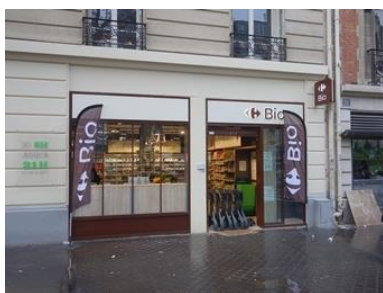
Test de magasins Carrefour 100% Bio à Paris