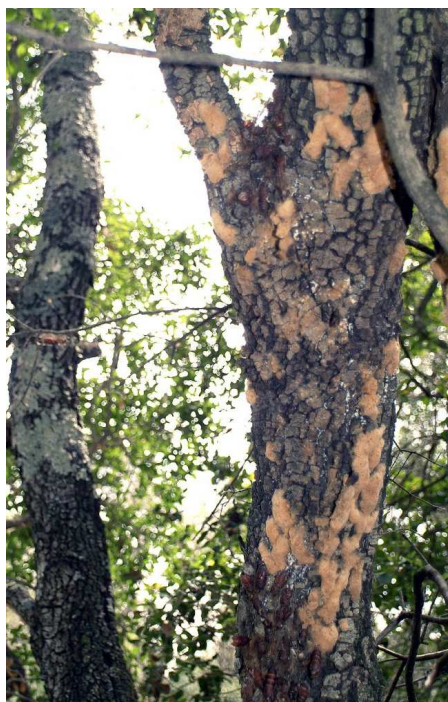
Pontes de bombyx disparate

A partir du troisième stade, elles se nourrissent plutôt la nuit et se reposent le jour dans des sites abrités (écorce, litière, ...).