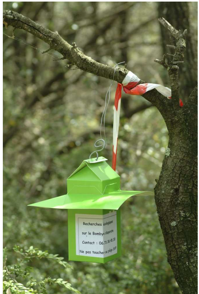
Piégeage phéromonal à des fins de suivi des populations

La recherche et le dénombrement des pontes pendant l'hiver permettent d'évaluer approximativement la densité locale des insectes et de définir par grandes zones concernées les risque de défoliation.