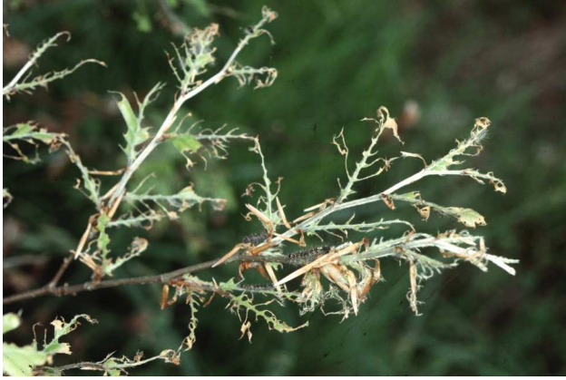
Dégâts sur rameau de chêne

Les défoliations partielles, même répétées, ne provoquent pas la mortalité directe des arbres. Toutefois, elles peuvent largement compromettre l'accroissement des arbres, les glandées et la reprise de jeunes plantations ou régénérations.