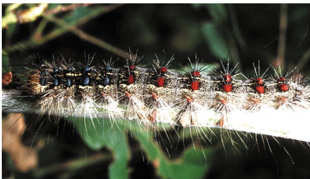
Chenilles au cinquième stade larvaire à livrée caractéristique : 5 paires de « verrues bleues » vers la tête, 6 paires de « verrues » rouges vers l'abdomen

Le développement nymphal dure environ 15 jours, entre fin juin et mi-août, puis les nouveaux papillons apparaissent.