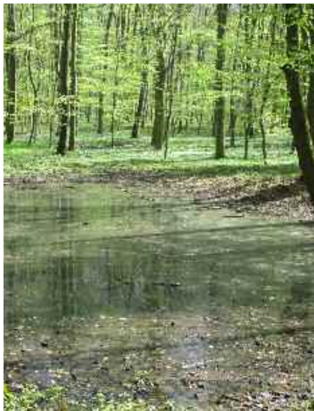
35. Le programme EFESSE constitue la contribution française à l'initiative de l'UE « cartographie et évaluation des écosystèmes et de leurs services dans l'UE – MAES ».

Au-delà de ce projet de portée nationale, la France doit être force de proposition au niveau de l'UE sur les approches permettant la prise en compte des services écosystémiques et la rémunération des services environnementaux liés dans la gestion forestière. Le comité spécialisé du CSFB, dédié à la gestion durable sera mis à contribution sur cette thématique.