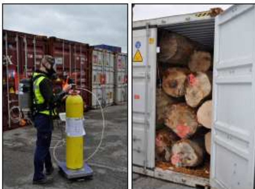
Traitement à Anvers

Les autorités sanitaires des autres pays européens ont été également interrogées.