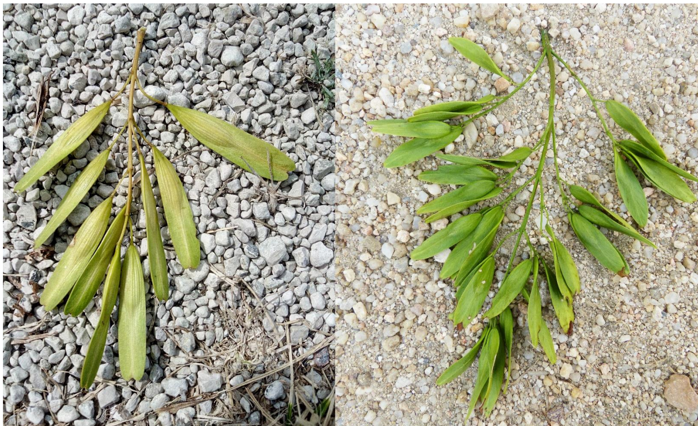
Comparaison des infrutescences du frêne oxyphylle (à gauche) et du frêne commun (à droite).

Le critère de distinction le plus fiable correspond au niveau de ramification des infrutescences. Elles sont toujours simples chez le frêne oxyphylle :