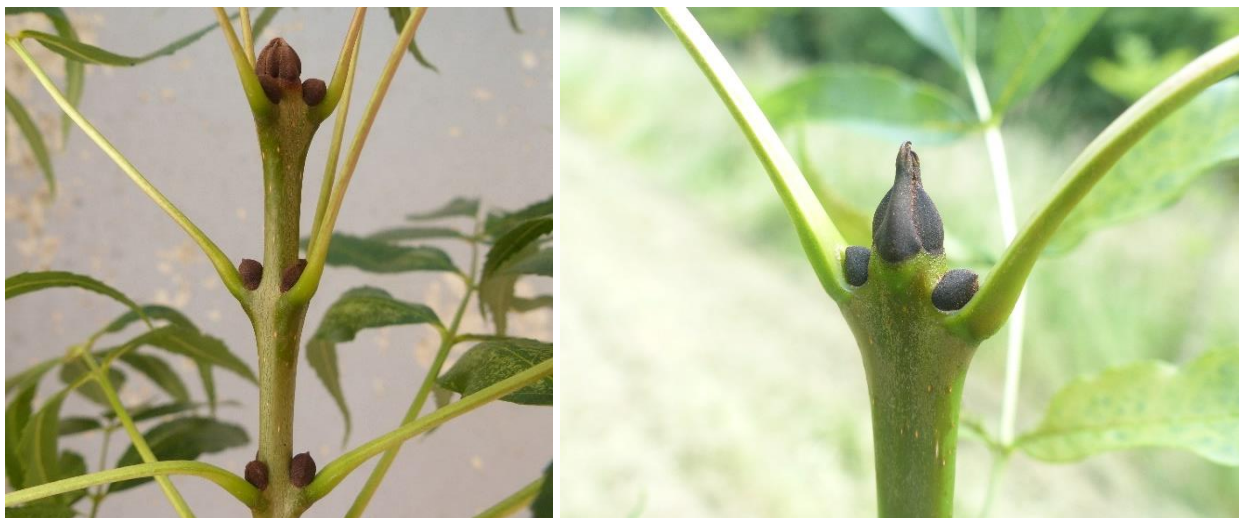
Bourgeons de frêne oxyphylle (à gauche) et de frêne commun (à droite).

Deux autres caractères distinctifs peuvent être relevés : le premier est l'aspect et l'insertion des bourgeons. Ceux du frêne oxyphylle sont souvent organisés par trois, au lieu de deux chez le frêne commun ; chez celui-ci, ce phénomène est quasiment inexistant. Noter la présence de feuilles insérées par trois au lieu de deux, un phénomène relativement fréquent chez le frêne oxyphylle.