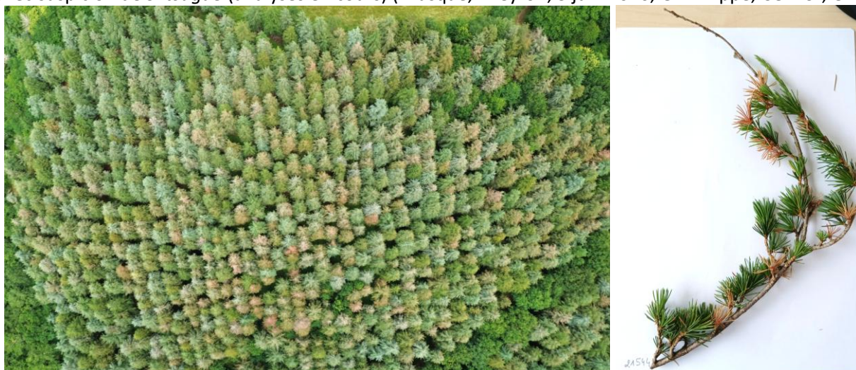
Fig.5 Rougissement-brunissement d'aiguilles de l'année, mortalité de pousses et de rameaux avec suspicion de S. tsugae (analyses en cours) (Cambounès, Tarn, 2 juin 2026, M. Ocana, CO-DSF, CNPF)