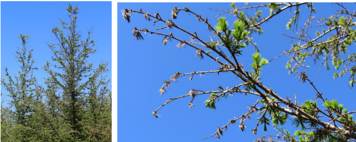
Fig.2 Mortalités de rameaux et aiguilles mortes attenantes avec détection de Sirococcus tsugae (Arfons, Tarn, 24 avril 2026, S. Bless, CO-DSF, ONF)

Ce champignon se disperse par voie aérienne , grâce au vent et aux précipitations. Il infecte son hôte lors de conditions atmosphériques humides . En revanche son caractère thermophile reste à préciser. Les infections primaires surviennent principalement au printemps et au début de l'été, peu après la feuillaison, lors de l'élongation des nouvelles pousses et lorsque la concentration en spores est à son maximum. Le champignon peut survivre dans les aiguilles, les tiges et la litière végétale au pied des arbres touchés.