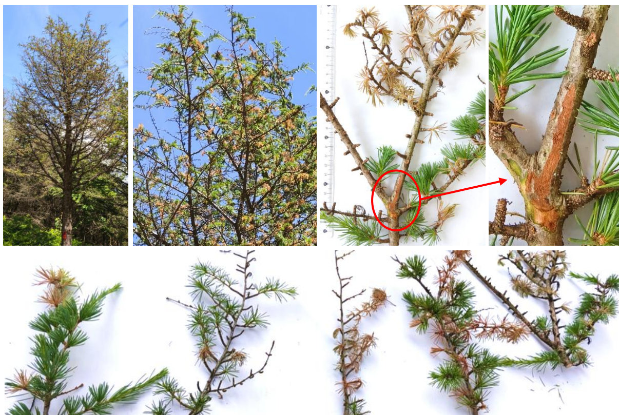
Fig.4 Rougissement-brunissement d'aiguilles de l'année, mortalité de rameaux et nécroses sous-corticales avec suspicion de S. tsugae (analyses en cours) (Brusque, Aveyron, 3 juin 2026)

Les symptômes provoqués par Sirococcus tsuga sont multiples et évolutifs dans le temps. On note tout d'abord des aiguilles mortes sur les pousses, sur les rameaux présentant une couleur rosée caractéristique et virant au brun au fil de la saison. Les aiguilles peuvent également tomber en cas d'infection. Des nécroses sous-corticales se développent ensuite sur les pousses et les branches, s'étendant dans le sens longitudinal. Celles-ci peuvent se caractériser par des lésions violacées ou des dépressions dans l'écorce, avec parfois un suintement de résine associé aux chancres. Des mortalités de branches surviennent quand la nécrose devient ceinturante. Des fructifications productrices de spores infectieuses apparaissent à la surface des chancres et sur les aiguilles mortes, en particulier en hiver. Au fur et à mesure des infections, des mortalités de rosettes, de pousses et de branches peuvent conduire à un fort déficit foliaire. La capacité photosynthétique des arbres se retrouve par conséquent diminuée lors de fortes atteintes. (Fig.2 à 6)