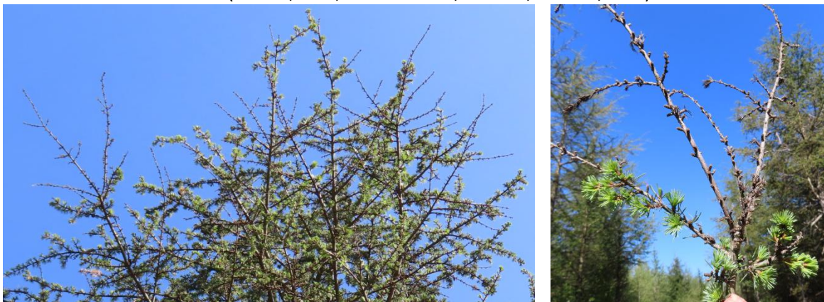
Fig.3 Mortalités de rameaux et aiguilles mortes attenantes avec détection de Sirococcus tsugae (Mélagues, Aveyron, 23 avril 2026, M. Mirabel, DSF)