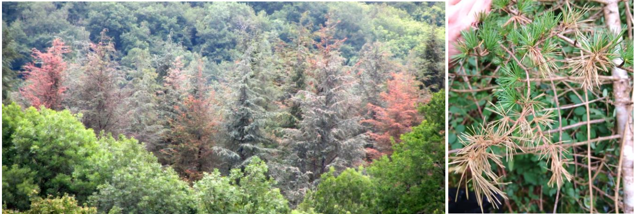
Fig.6 Rougissement-brunissement d'aiguilles de l'année, mortalité de pousses et de rameaux avec suspicion de S. tsugae (analyses en cours) (Sauveterre-de-Comminges, Haute-Garonne, 1 er juin 2026, L. Paradowski, CO-DSF, CNPF)