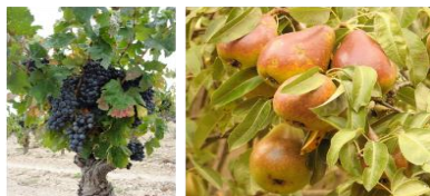
3 cultures étudiées : Pommes de terre, vigne et poire