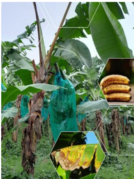
Photo 1 : Bananier sans feuille à cause de la cercosporiose noire (nécroses, fruits tigrés)

Changement d'Echelle pour les solutions alteRnatives de protection contre la cerCOsporiose noire du bananier en conditions TROPicales des Antilles