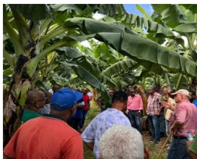
Photo 2 : Présentation d'un dispositif expérimental « essai système »

L'objectif de ces parcelles systèmes sera non seulement scientifique, mais surtout démonstratif d'une possibilité de gestion alternative de la maladie pour le producteur.