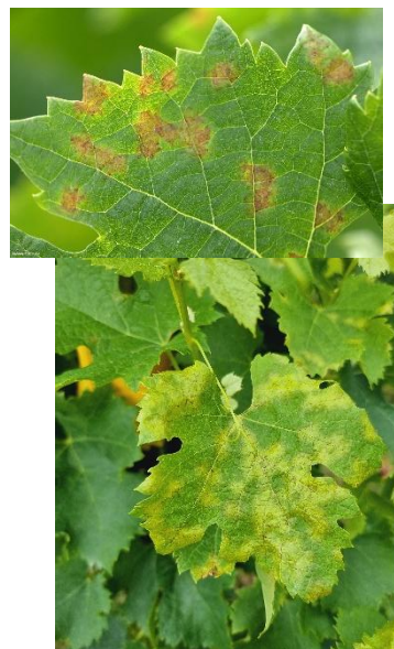
Photos : Feuilles de vigne infectées par le mildiou