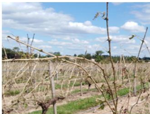
Vigne : feuillages détruits, rameaux marqués ou cassés, grappes abîmées ou détruites