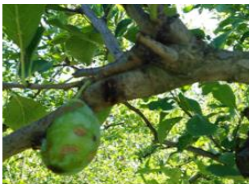
Une prune impactée

dommages sur les arbres qui auront probablement un impact sur la récolte 2023 (pertes de fonds). Sur vergers protégés, du fait de l'effet tempête qui aurait projeté la grêle latéralement, des destructions de bois sont également observables en périphérie. Par endroits, les protections de type filets paragrêle ont été détruites par les grêlons qui en s'accumulant ont fait plier les protections. Les dégâts chez les producteurs auront vraisemblablement des répercussions sur la filière, notamment sur les transformateurs à l'aval qui auraient peu ou pas de stock (prune d'ente notamment).