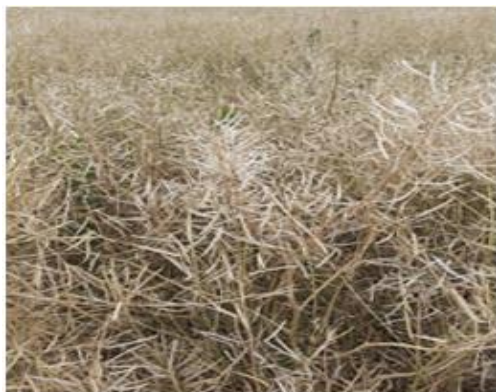
Siliques de colza éclatées