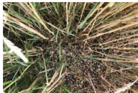
Blé : grains au sol