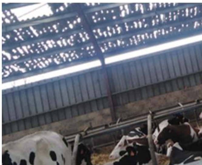
Vaches laitières sous une toiture perforée

Les fourrages stockés sous les bâtiments endommagés, sont détrempés et dégradés par les pluies. Les surfaces fourragères en cours d'exploitation (prairies, maïs...) enregistrent des pertes de rendement ("ce sera une coupe de luzerne en moins"). Les exploitants sont inquiets de devoir racheter des aliments dans un contexte de prix de marché élevés. Les impacts de grêle sont autant d'entrées favorisées aux ennemis des cultures. Les éleveurs alertent sur de possibles conséquences à moyen terme d'un fourrage récolté malgré tout et stocké mais de mauvaise qualité et donc de moindre apport alimentaire. D'ores et déjà des fournisseurs ont annoncé des difficultés d'approvisionnement en matières premières.