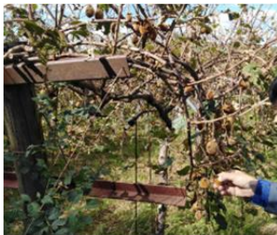
Kiwi : fruits et bois endommagés

dommages sur les arbres qui auront probablement un impact sur la récolte 2023 (pertes de fonds). Sur vergers protégés, du fait de l'effet tempête qui aurait projeté la grêle latéralement, des destructions de bois sont également observables en périphérie. Par endroits, les protections de type filets paragrêle ont été détruites par les grêlons qui en s'accumulant ont fait plier les protections. Les dégâts chez les producteurs auront vraisemblablement des répercussions sur la filière, notamment sur les transformateurs à l'aval qui auraient peu ou pas de stock (prune d'ente notamment).