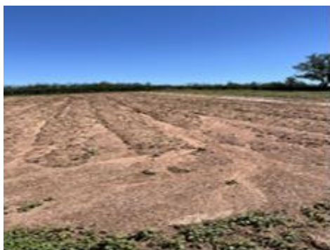
Maraîchage : pertes de fonds (courges et pommes de terre)