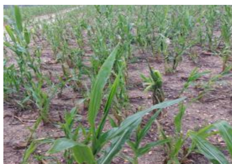
Maïs prévu pour l'ensilage

Dans les zones d'élevage, d'importants dommages ont été observés, touchant le bâti, les installations et les cultures fourragères non encore récoltées. Dans certaines exploitations, la dégradation des bâtiments est telle qu'ils ne sont plus en mesure d'abriter les animaux et les fourrages. Ils nécessiteront pour certains d'importants travaux pour être réhabilités et fonctionnels afin d'entreposer les récoltes en cours et héberger les animaux à la saison prochaine. L'écart est parfois grand entre l'ampleur des dégâts et la capacité des entreprises locales à y faire face.