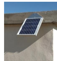
Station d'irrigation équipée d'un panneau solaire, irrigation de la haie brise vent double avec l'eau des contre-lavages