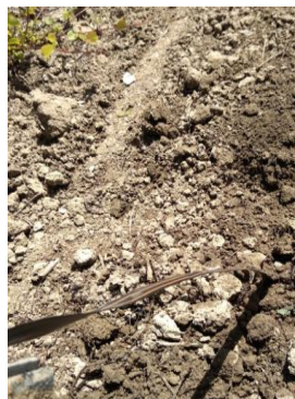
Irrigation enterrée sur VMPG