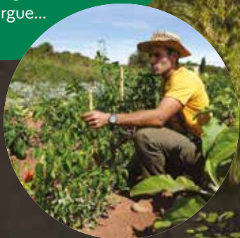
Maraîcher en agriculture biologique sur le site de Fabrègas (83)