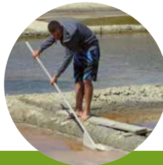
Saunier sur le site du Marais d'Olonne (85)

En complément des logiques de filières déjà organisées, l'agriculture littorale doit tirer parti des atouts spécifiques des territoires : la proximité de nombreux consommateurs à l'année, renforcée en période estivale, par l'affluence des touristes offrent des opportunités commerciales comme la vente des produits en circuits courts et l'accueil à la ferme : activités pédagogiques autour d'ateliers de transformation, dégustations des produits, restauration et hébergement. Le Conservatoire du littoral favorise des agricultures intégrées aux territoires, dans le respect de la diversité et des spécificités de ses sites protégés mais également des pratiques agricoles.