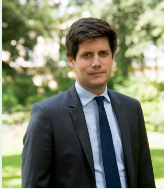
Julien Denormandie, ministre de l'Agriculture et de l'Alimentation

« Un tel recensement est indispensable pour relever les défis qui nous attendent. Nous avons besoin de recueillir des données précises pour observer les mutations des systèmes agricoles français, mesurer l'importance de notre agriculture française au sein de l'Union européenne et déployer toutes les mesures nécessaires pour préparer l'agriculture de demain.