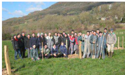
Etudiants en Bac pro CGEA et BPREA : plantation en agroforesterie. Projet Tiers temps de l'EPLEFPA La Cazotte – Saint-Affrique