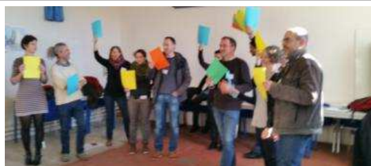
Séminaire annuel ADT- 2016 - Bergerie nationale

Une fois par an, un séminaire est organisé pendant deux jours à la Bergerie nationale de Rambouillet. Il permet de regrouper tous les intervenants du dispositif tiers temps et chefs de projet. C'est un moment de capitalisation, de synthèses et d'échanges. Les comptes-rendus et les supports d'interventions sont à disposition sur la conférence et sur le site : www.adt.educagri.fr