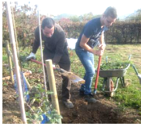
Etudiants en BTSA Aménagements paysagers sur un chantier d'écoconception paysagère dans le cadre du Tiers temps de l'EPLFPA Le Mans)

Note de service DGER/SDRICI annuelle: appel à propositions de projets contribuant à la mission d'animation et de développement des territoires, ou à vocation éducative, au sein des établissements publics locaux d'enseignement et de formation professionnelle agricoles.