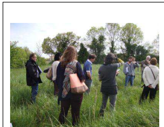
Groupe de travail sur la gestion des haies multifonctionnelles, plan de gestion valorisation technique et pédagogique

Des groupes de travail ont été mis en place depuis 2016 (exemples : Faire de son projet ADT un projet pédagogique et éducatif, la gestion des haies multifonctionnelles). Ils bénéficient d'un accompagnement du CEZ-Bergerie nationale et des animateurs thématiques de la DGER. Des accompagnements pédagogiques sur site sont possibles.