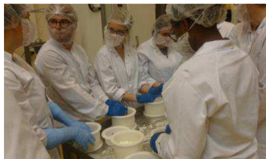
Etudiants en BTS Sciences et techniques des aliments lors d'un voyage transfrontalier de découverte à la rencontre de professionnels belges. Projet Tiers temps de l'EPLEFPA de Nancy-Pixérécourt