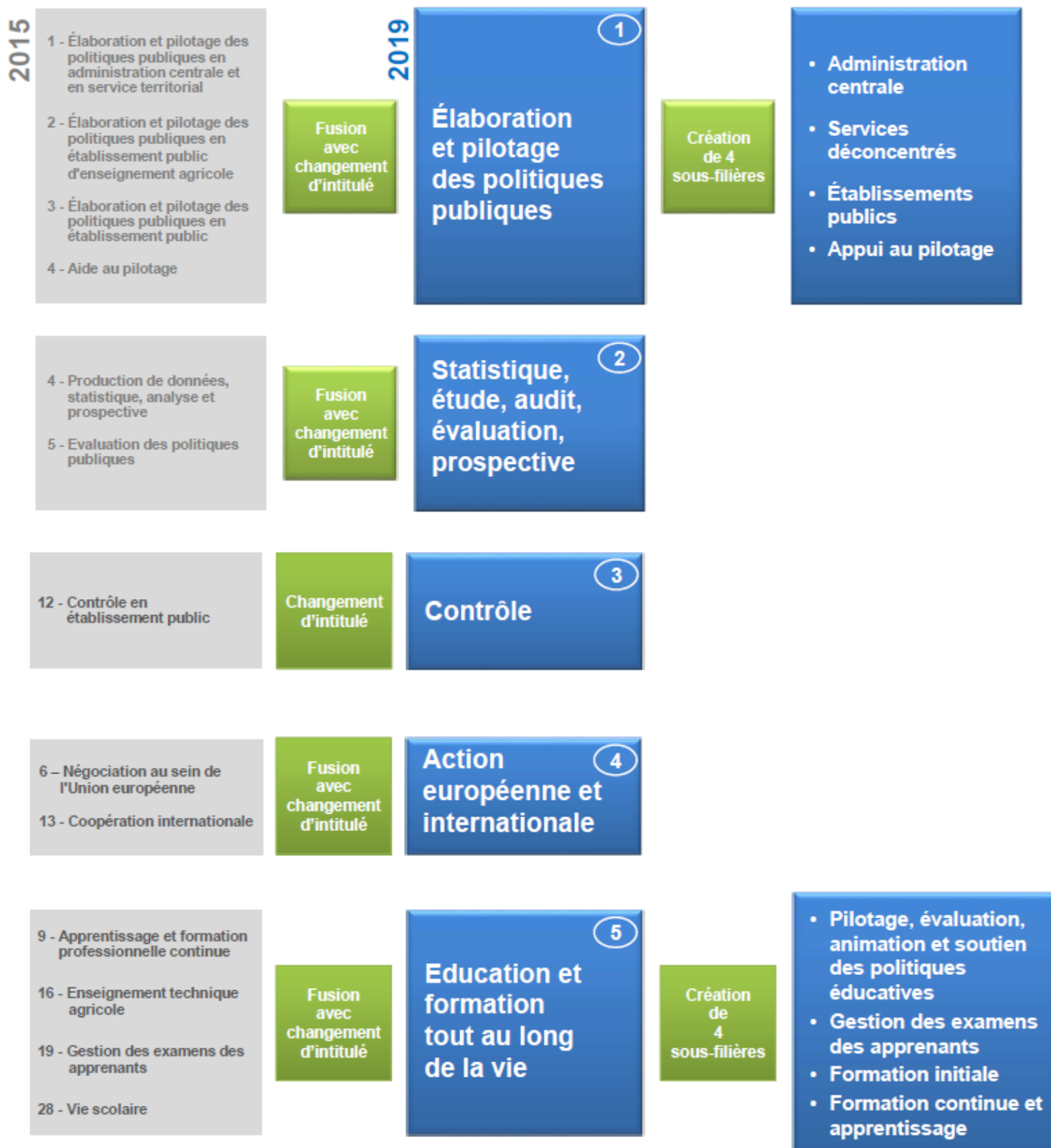
Schéma de correspondance entre les anciennes et les nouvelles filières d'emploi