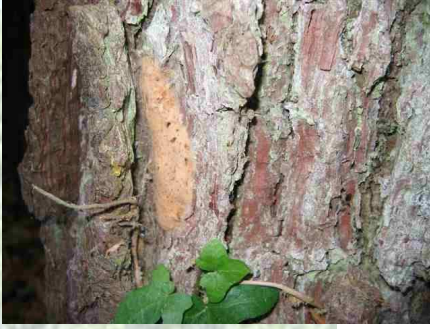
Ponte de bombyx disparate

Des populations localisées de hannetons communs ont été observées, notamment en forêt de Moulière (est de la Vienne).