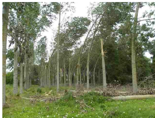
Peupliers courbés et volis suite à la tempête

Les attaques de puceron lanigère ont été plus fortes qu'en 2011, année de leur dernière apparition. Les colonies sont essentiellement apparues en automne. Il sera important de porter attention à la réaction des arbres colonisés au moment du débourrement ce printemps.