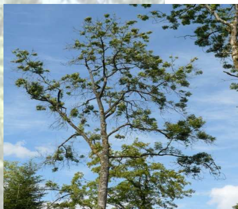
Frêne atteint par la chalarose en Haute-Saône

Comme l'an passé, les parasites, dits de quarantaine, ont fait l'objet d'un suivi spécifique sur l'ensemble du territoire national. La surveillance du nématode du pin a été renforcée. Les prélèvements et analyse de bois ont été complétés par la mise en place d'un réseau de piégeage du coléoptère ( Monochamus galloprovincialis ) assurant le transport de ce parasite. Aucun nématode n'a été détecté sur bois ou insectes piégés.