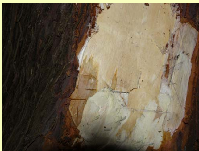
← Début de l'expression des symptômes

Les nécroses en flamme au bas du tronc, la transmission de la maladie aux arbres voisins et le climat approprié pour les Phytophthora pourraient faire penser à une attaque de P. lateralis , mais les différentes analyses n'ont pas permis de le confirmer.