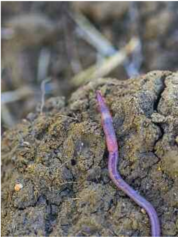
Cherckh Sarrour @ INRA_Agri