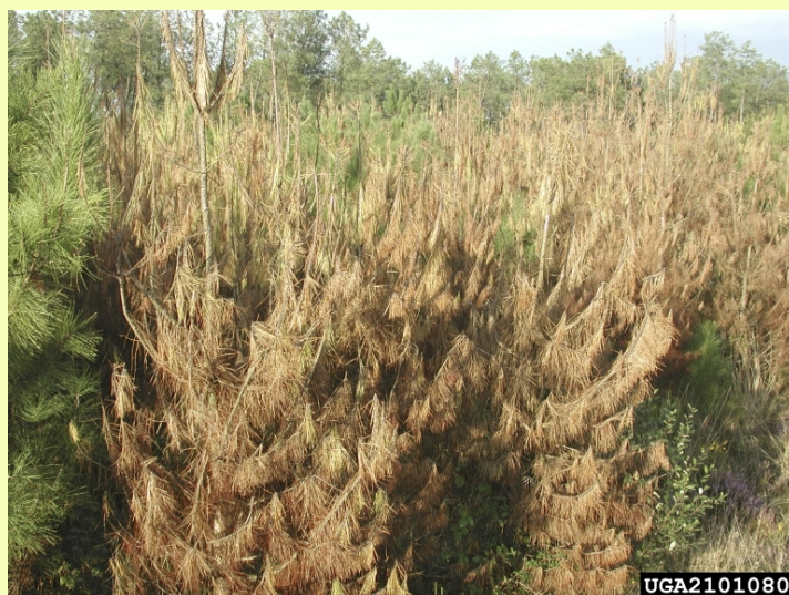
Pins atteints par Ips sexdentatus ,