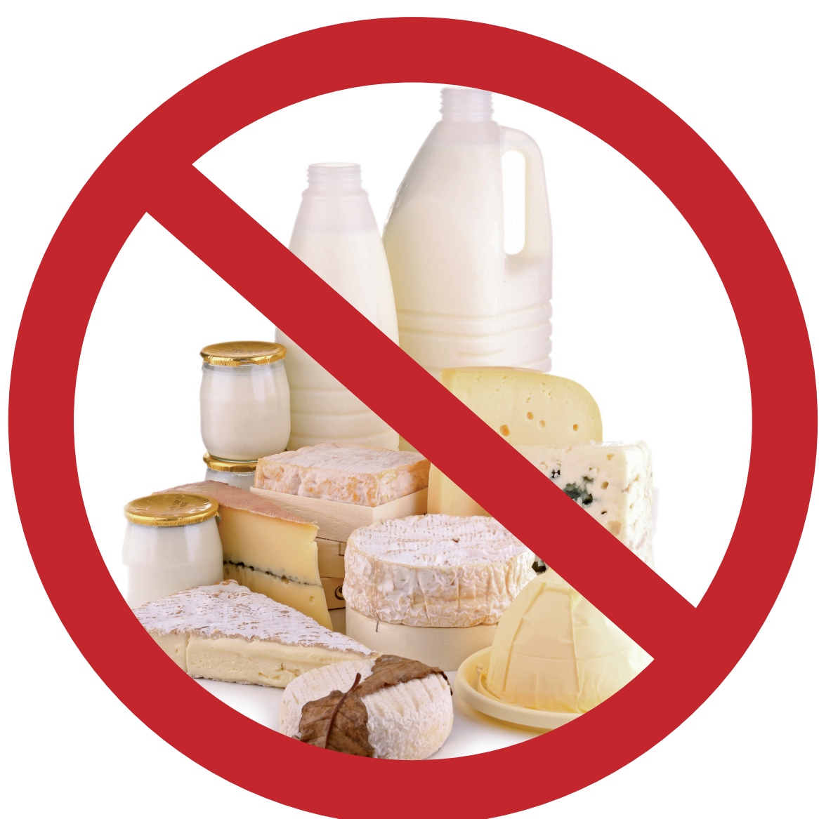
Lait Produits laitiers

Il vous est INTERDIT de transporter dans vos bagages personnels des produits d'origine animale. Ils peuvent causer de graves maladies infectieuses.