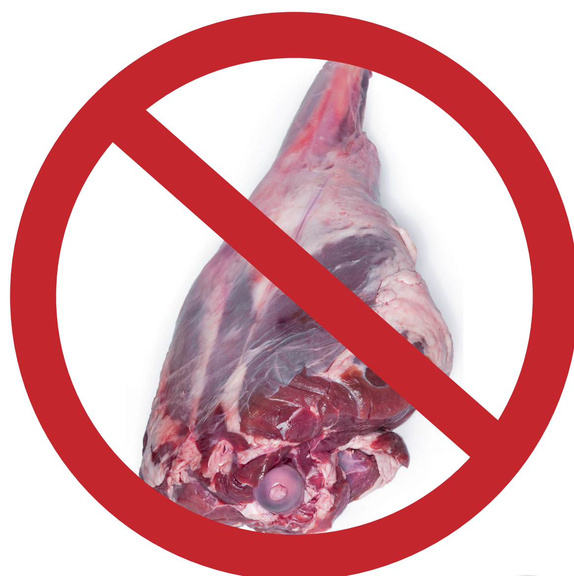
Viande de boucherie Viande de brousse