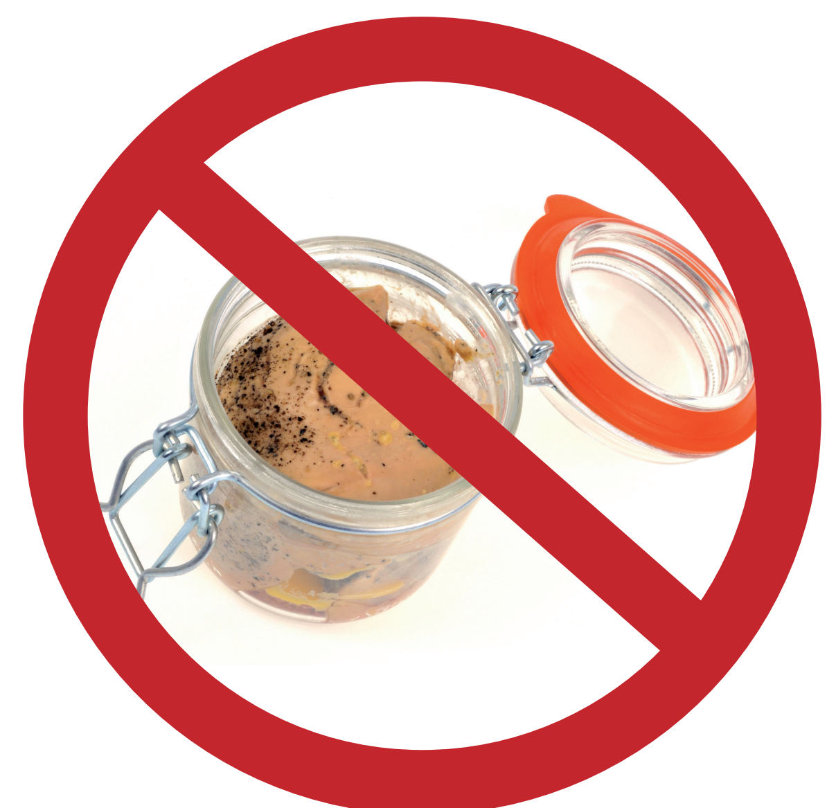
Produits à base de viande