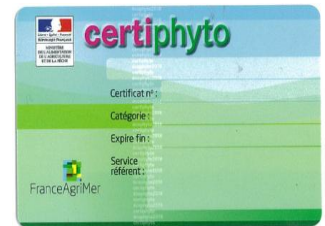
Figure 2 : la face verso du Certiphyto

Au 1 er octobre 2014, près de 800 000 personnes devront être certifiées.