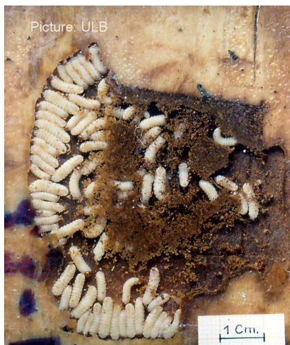
Larves de dendroctone dans la chambre familiale sous corticale.

Les femelles fécondées partent à la recherche d'un arbre hôte afin d'effectuer leur ponte. En France les attaques de dendroctone n'ont été notées par le DSF que sur épicéas commun et de Sitka. L'état de santé de l'arbre ne semble pas intervenir dans le choix du dendroctone : pourvu d'une résistance notable à la résine et aux effets toxiques des monoterpènes émis par l'arbre en guise de défense (Everaerts et al., 1988), le dendroctone est un ravageur primaire. Il s'installe généralement au sein d'arbres parfaitement sains et de préférence sur des arbres de diamètre important. On observe toutefois que l'état d'affaiblissement général des peuplements, du fait d'une mauvaise adaptation à la station, de choix sylvicoles inadaptés, ou lié à des conditions climatiques difficiles, est un facteur favorisant les pullulations de l'insecte. En particulier, dans le Jura, il semble que le dendroctone attaque préférentiellement les arbres affaiblis par des dégâts d'exploitation. De même des observations effectuées en Normandie montrent que le dendroctone attaquerait préférentiellement des arbres ayant subi un élagage artificiel. Un lien a été mis en évidence dans certains pays (Grégoire, 1988) entre les attaques de l'insecte et l'infestation des arbres par certains champignons ( Heterobasidion annosum et Armillaria sp.). De