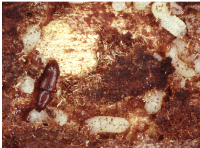
Rhizophagus grandis adulte dévorant une larve de dendroctone

Aussi, la présence de Rhizophagus grandis dans un peuplement donné est-elle inféodée à celle de sa proie. Toutefois, les capacités de dissémination à longue distance de Rhizophagus grandis sont plus faibles que celles de Dendroctonus micans si bien que l'expansion de l'aire de présence du dendroctone est plus rapide que celle de son prédateur. Cela donne lieu à des dégâts importants sur les zones où ce ravageur prolifère en l'absence de régulation, et ceci pendant la dizaine d'années nécessaires au prédateur pour rejoindre sa proie.