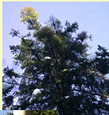
Houppier ► fortement gité