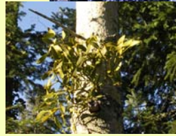
gui sur le tronc