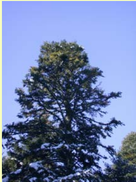
Houppier dégradé avec mortalités de branches ►