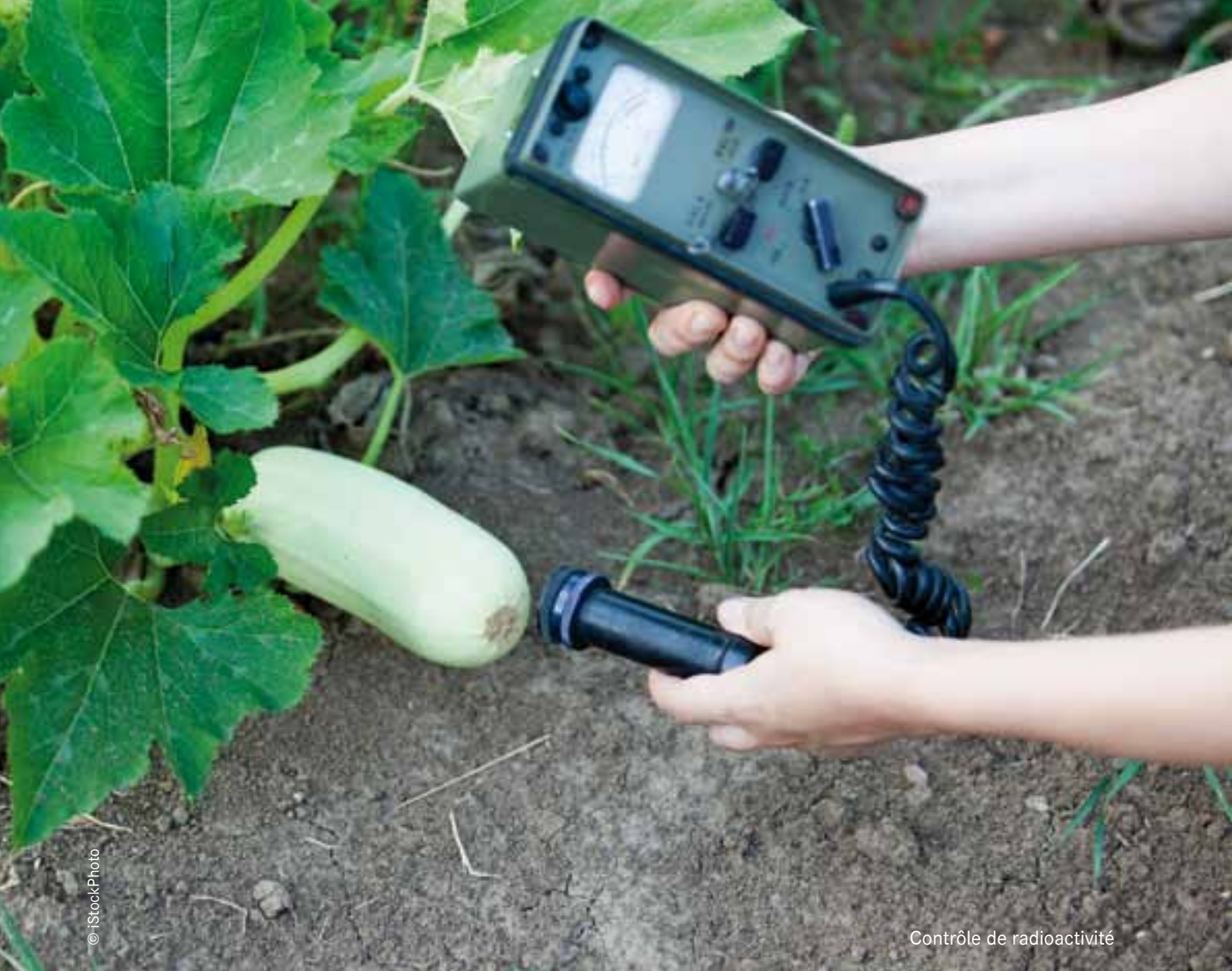
Contrôle de radioactivité