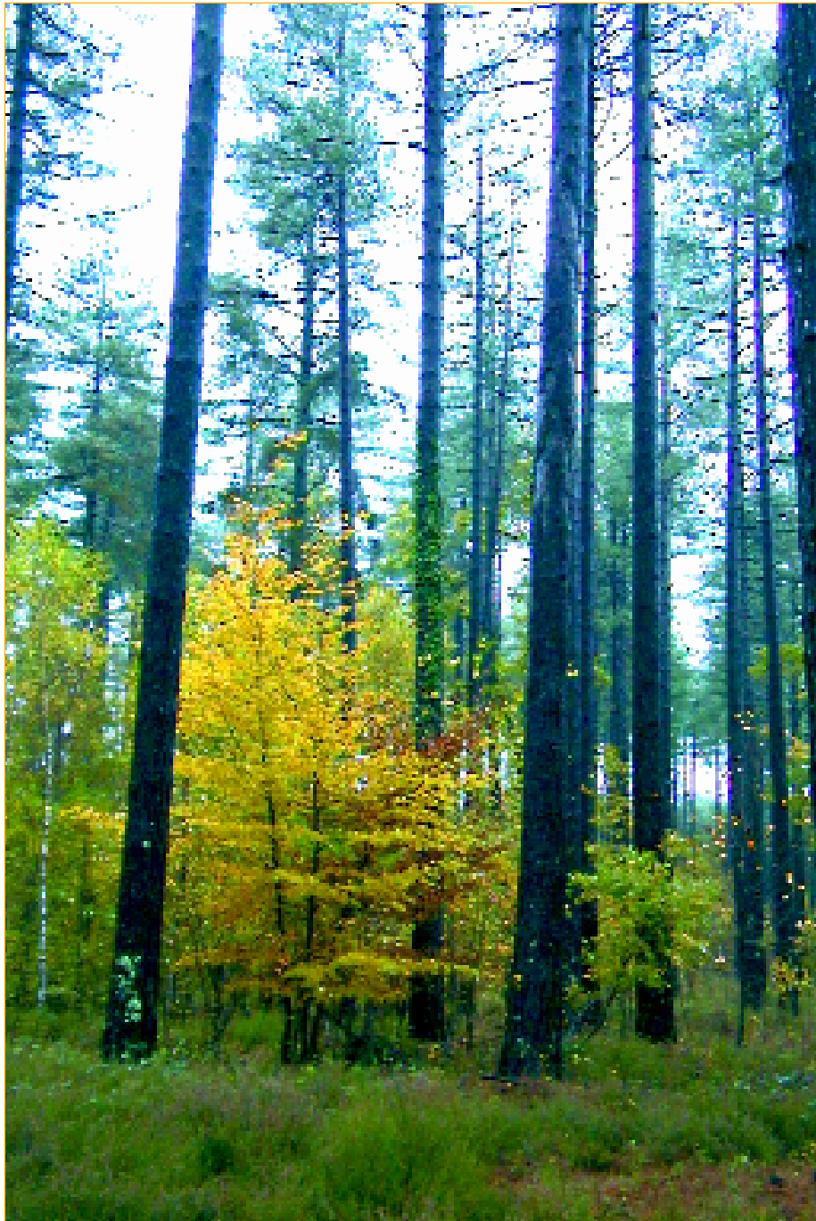
Peuplement de pins laricios de Corse