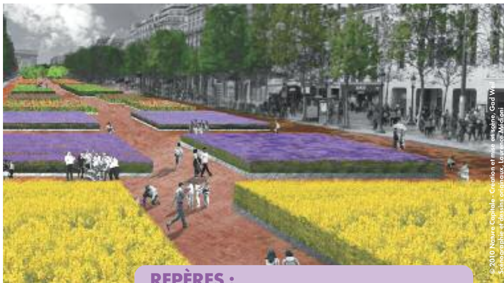
© 2010 Nature Capitale - Création et mise en scène, Gad Weil - Scénographie et décors originaux, Laurence Médioni

Nous voulons surtout partager avec le public une émotion poétique, une réflexion collective sur l'avenir de notre bien commun qu'est la nature. J'espère que l'image que tout le monde retiendra, c'est l'émerveillement dans le regard des enfants.